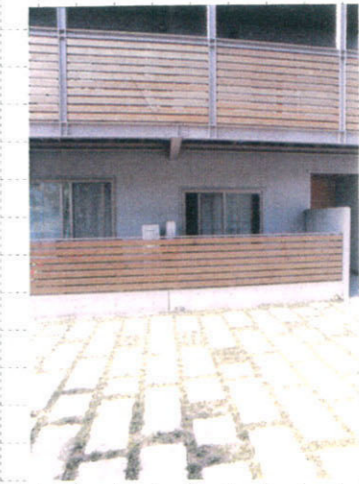
前庭、来客用駐車場